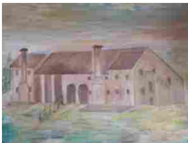
La vecchia grande casa di Nonno Natale (che non esiste più) in una tempera di Oddone Quaggio, originario di Brugine (Pd)

Il ricordo di un “viaggio” lungo i fossi, per andare a trovare il nonno, di un bambino di otto anni che oggi ne ha quasi ottanta. Il fosso e il viaggio, diventano il filo conduttore di un pezzetto di vita d'altri tempi che Orazio ci regala con questo bello scampolo di lingua veneto-padovana