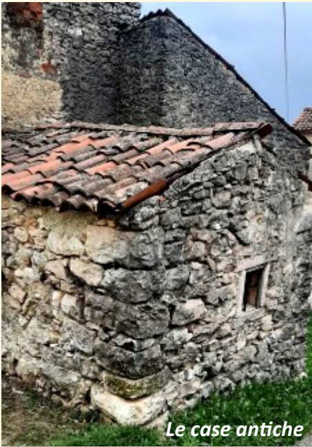
Le case antiche

Ogni tanto un grosso boato faceva sussultare la terra...".