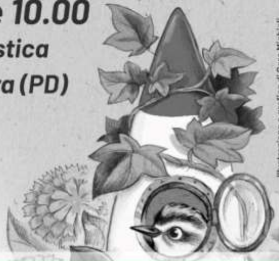
illustrazione e grafica di Sara Micheli

Da luogo di armi a luogo di pace a servizio della Comunità di Bagnoli di Sopra . L'intervento di Centoboschi non è solo un omaggio alla natura ma è un gesto di pace affinché il mondo