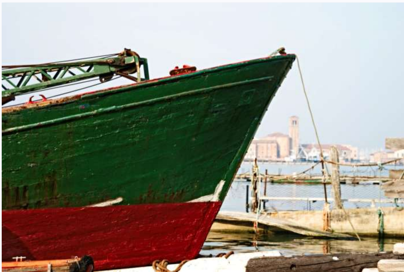
La prua della Freccia Azzurra, una gabarra a motore completamente costruita in legno, lunga 20.90 metri e larga 4.92, con una stazza lorda di 28 tonnellate

Maurizio: la rivalutazione delle aree fluviali sta rinascendo negli ultimi anni. Nel Comune di Battaglia Terme, si ampliano le opere di valorizzazione e cura di argini e percorsi panoramici. C'è da dire che si è lontani da un livello ottimale di manutenzione poiché i comuni non dispongono delle risorse economiche di cui dispone la Regione, perciò l'intervento è comunque limitato. Il problema rimane che comunque nei decenni di sviluppo urbano i corsi d'acqua hanno subito restrizioni e interramenti che hanno aumentato il rischio idrogeologico.