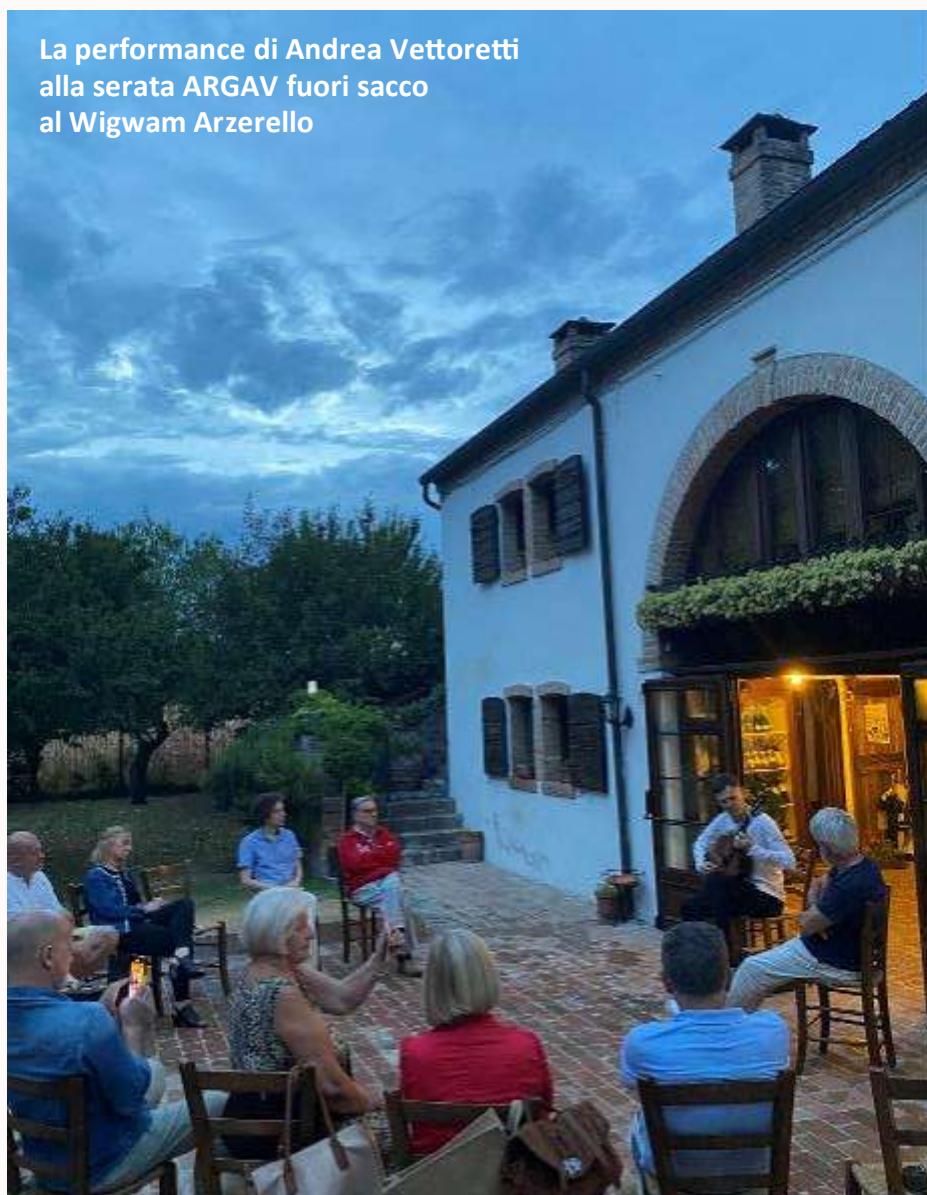
La performance di Andrea Vettoretti alla serata ARGAV fuori sacco al Wigwam Arzerello

La musica è stata invece ad opera di Andrea Vettoretti , chitarrista di fama internazionale che ha presentato ai presenti un'anteprima del suo nuovo CD “Quantum one” dedicato all'Universo ed ai suoi suoni. Un'interazione con i suoni cosmici dove tradizione e innovazione si uniscono per ottenere suggestio-