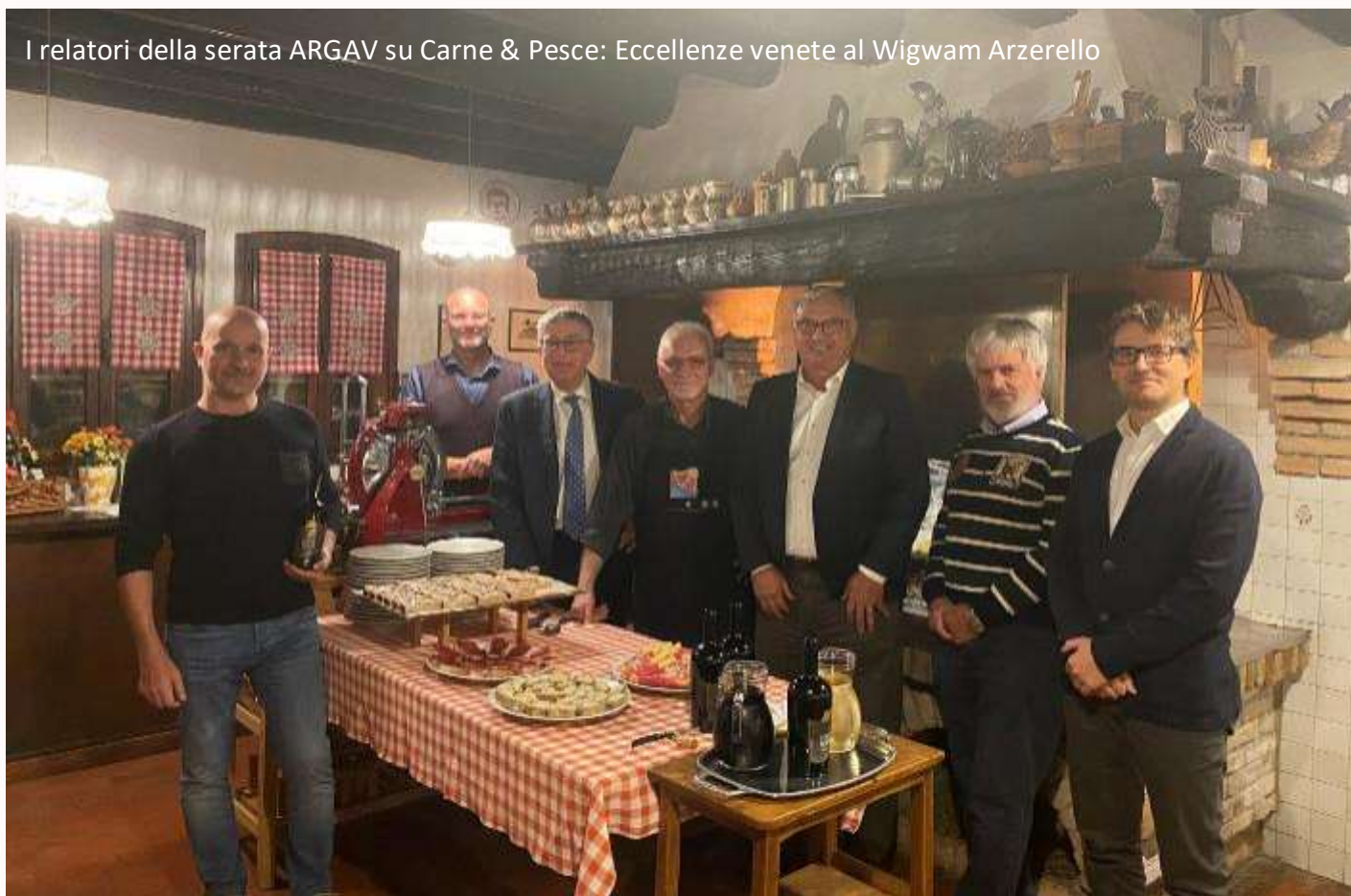
I relatori della serata ARGAV su Carne & Pesce: Eccellenze venete al Wigwam Arzerello

Al termine, come di consueto, c'è stato il “buon convivio” con assaggi di cibi e di vini, preparato dello staff del Circolo di Campagna Wigwam ospitante ■