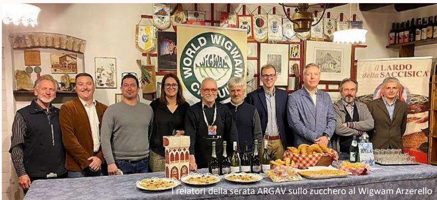
I relatori della serata ARGAV sullo zucchero al Wigwam Arzerello