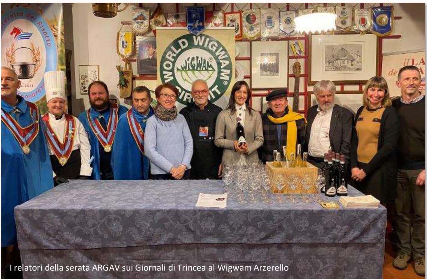
I relatori della serata ARGAV sui Giornali di Trincea al Wigwam Arzerello

Come di consueto, il “buon convivio” degli assaggi di cibi e di vini è stato preparato dalle esperienze presenti col supporto dello staff del Circolo di Campagna Wigwam ospitante ■