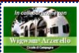
In collaborazione con Wigwam Arzerello Circolo di Campagna Il Circolo di Campagna Wigwam "Arzerello" APS di Piove di Sacco (Pd)

Il convivio è un momento importante dei nostri incontri, perché davanti ad un buon piatto si supera qualsiasi etichetta ed il rapporto umano diventa diretto, chiunque sia l'interlocutore