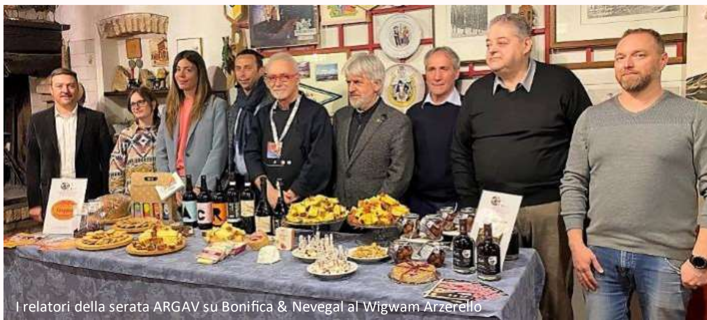
I relatori della serata ARGAV su Bonifica & Nevegal al Wigwam Arzerello

Nell’occasione, è stata data illustrazione dello stato dell’arte del progetto CEP – Cantieri di Esperienza Partecipativa 2021-22 cui aderisce anche ARGAV ■