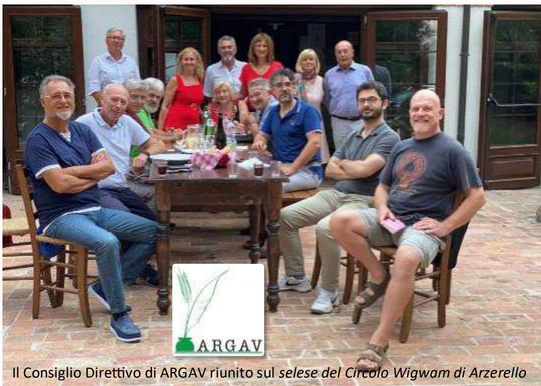
Il Consiglio Direttivo di ARGAV riunito sul seleso del Circolo Wigwam di Arzerello

Ciò ha portato alla necessità di maggiore attenzione nella definizione delle tematiche, senza dimenticare, però, uno spazio lasciato ad argomenti meno im-