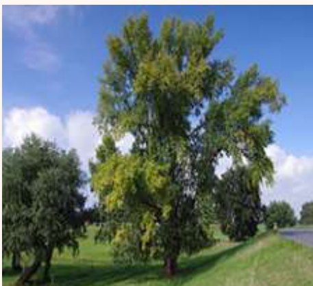
Il pioppo nero

verse specie di uccelli acquatici, tra cui l'airone cenerino, la folaga, la gallinella d'acqua, il germano reale, il tarabusino, il tarabuso, il tuffetto, alcuni picidi, come il picchio rosso maggiore e il torcicollo nonché passeriformi, tra cui la ballerina bianca, la cannaiola, il cannareccione, la capinera, la cinciallegra, la cinciarella, il fringuello, il pendolino, la sterpazzola e l'usignolo di fiume. Non mancano a completare la vasta selezione anche al-