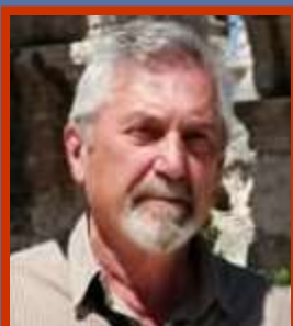
Giorgio Pavan Wigwam Local Community Alto Polesine

c/c Postale n. 69120327 intestato a Wigwam APS Italia o con bonifico a IBAN IT86X0760112100000069120327 BIC/SWIFT BPPIITRRXXX