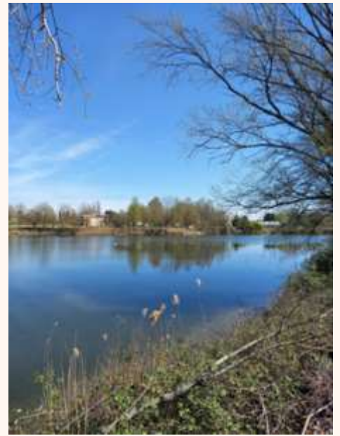
Il Gorgo Zùcolo a sinistra e il Gorgo della Sposa al centro e foto a destra

una proficua giornata in tutti i sensi...!