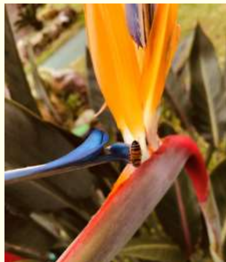
Ape su fiore di strelitzia

Avremo modo di osservare protetto all'interno di una teca di vetro un favo naturale carico di miele, proveniente da un'arnia particolare detta arnia cattedrale, dove le api si costruiscono il favo senza