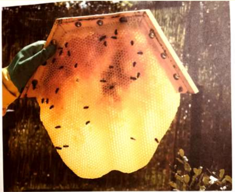
IL FAVO STILLANTE