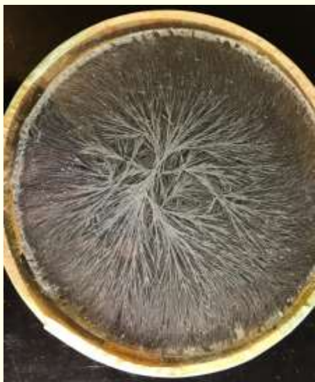
Analisi di cristallizzazione sensibile del miele

tua lingua e il profumo delle tue vesti è come il profumo del Libano.”