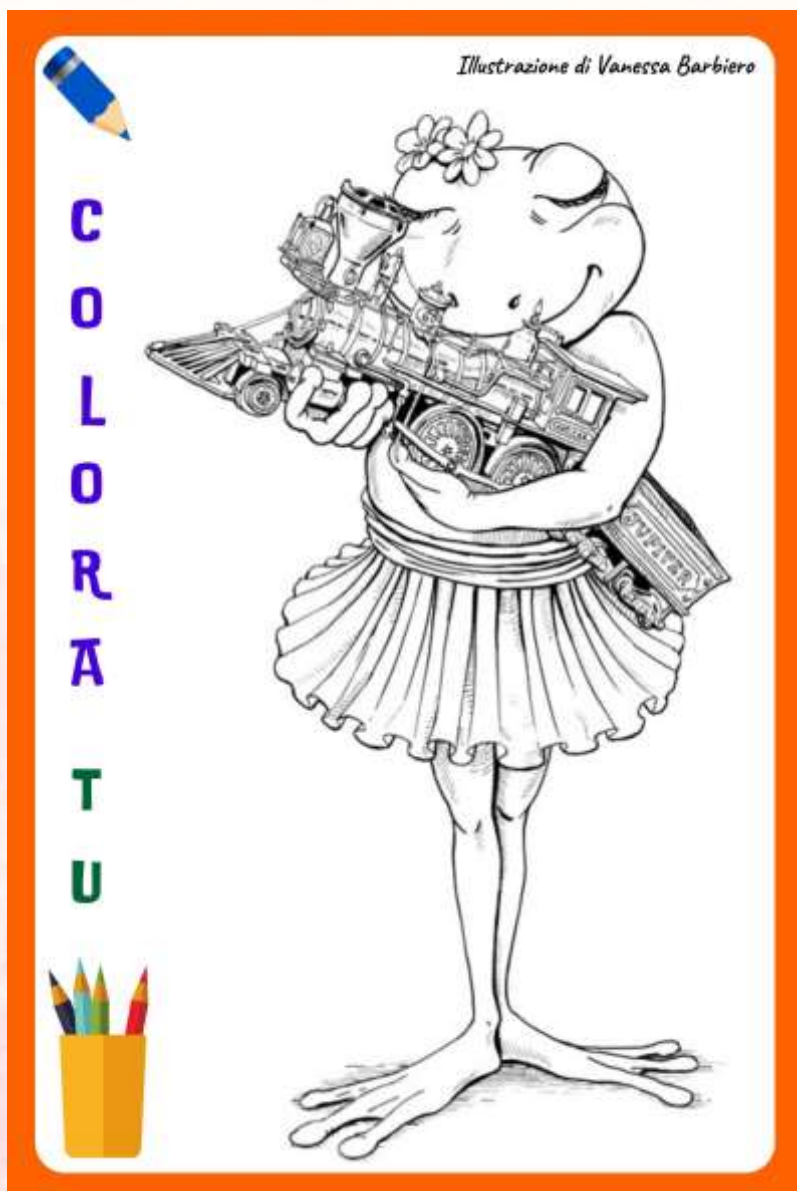
Illustrazione di Vanessa Barbiero

La Wigwam Local Community Padova Est - Italy