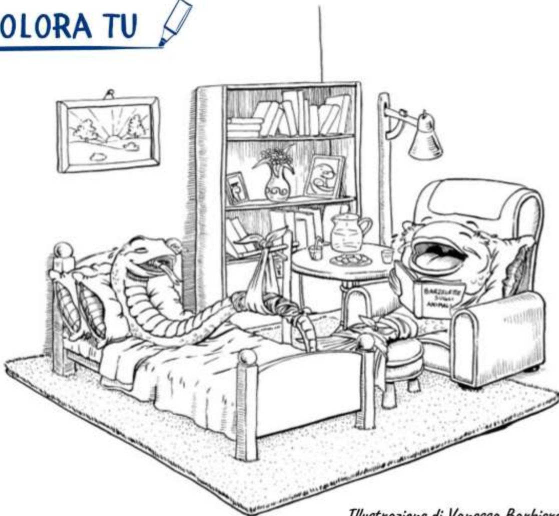
Illustrazione di Vanessa Barbiero