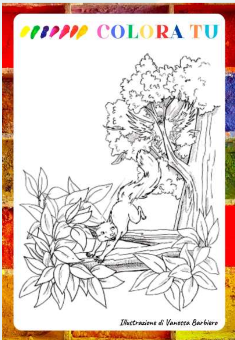
Illustrazione di Vanessa Barbiero

Poi, quando l'uccello ebbe finito, cominciò lo scoiattolo a fare