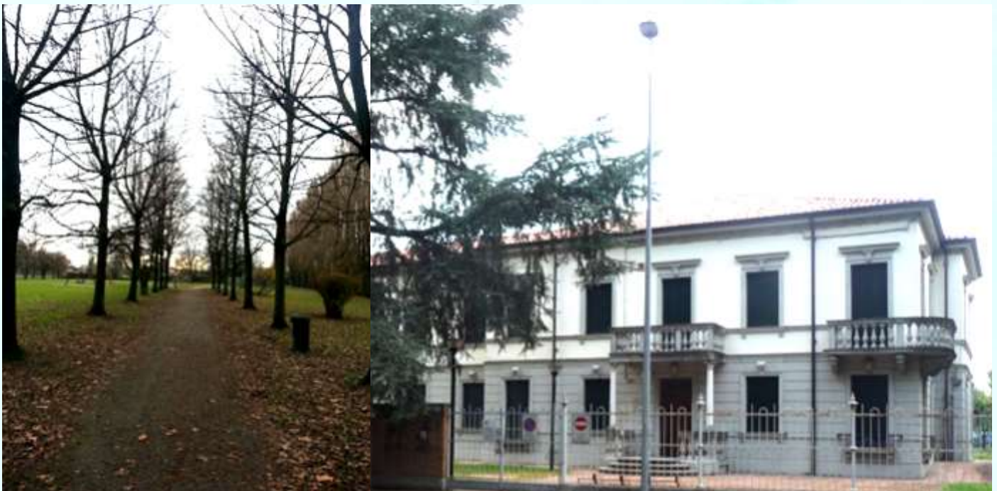
VILLA BERTA E IL SUO PARCO

Villa Berta divenne poi sede di uffici comunali, del Consiglio di Quartiere 3 Est e di alcuni servizi dell'Usl 16, con delle sale per riunioni delle associazioni tra cui quella del Gruppo Anziani. Nel 2020 l'Amministrazione Comunale diede in concessione l'edificio ad un'associazione privata che si occupa di disabilità.