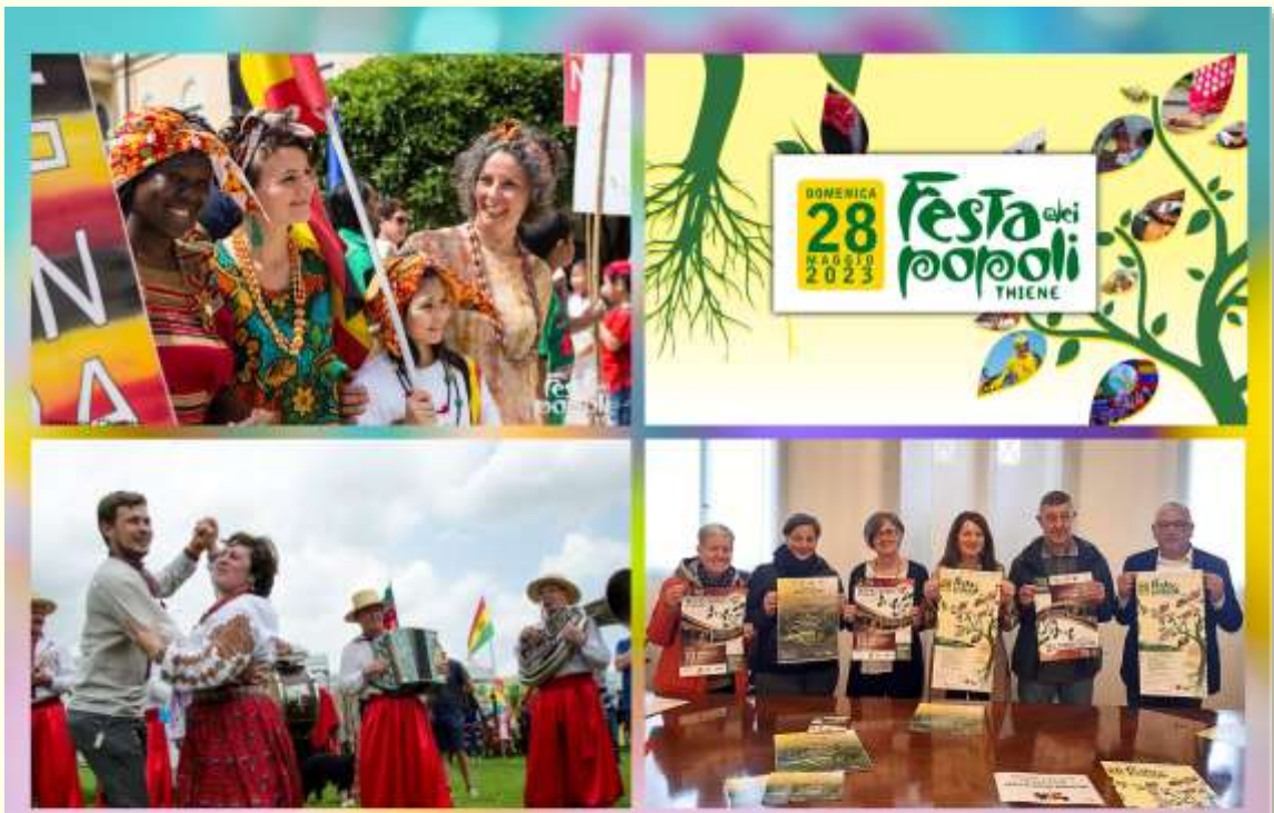
14° FESTA DEI POPOLI THIENE: RADICI CHE SI INCONTRANO... RAMI CHE SI UNISCONO

Guardandolo dal punto di vista dell'uomo, il significato di ambiente indica l'insieme delle condizioni sociali, morali, culturali, storiche ed economiche in