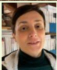
Anita Tassinato Redazione WigwamNews

c/c Postale n. 69120327 intestato a Wigwam APS Italia o con bonifico a IBAN IT86X0760112100000069120327 BIC/SWIFT BPPIITRRXXX