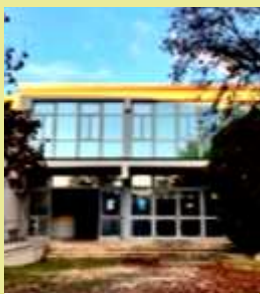
I ragazzi della Classe 3^F - di anni 13 Scuola Levi Civita di Padova-Camin (Pd)

Lavori candidati al Premio Wigwam Stampa Italiana 2023 Giovani comunicatori per Comunità resilienti → info@wigwam.it