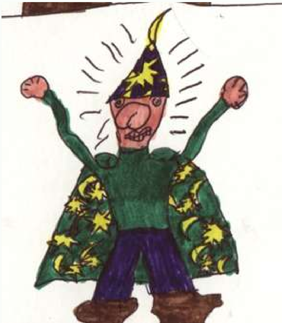
Disegno di Jacopo - Il mago nasone

Anche i "cattivi" non sono poi così cattivi, in fondo, in queste dodici storielle, e tutti alla fine sono più buoni che all'inizio ... merito dell'eccellente distributore Pirimpino: l'inconsapevole (ma non sempre) distributore di bontà. E non si erge a maestro di nes-