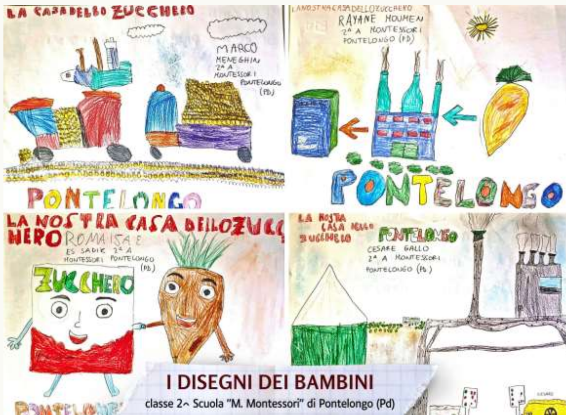
I DISEGNI DEI BAMBINI classe 2 a Scuola "M. Montessori" di Pontelongo (Pd)

I benefici che ritengo che questo premio porterà alla comunità e ai giovani partecipanti sono la scoperta e la conoscenza di una realtà misconosciuta pur presente vicino a casa