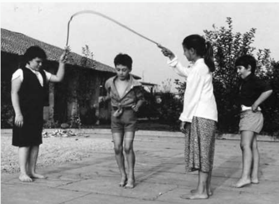
Una volta ci si divertiva con poco