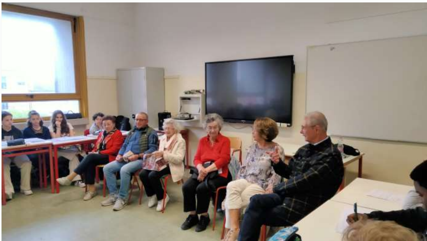
I racconti dei nonni ai ragazzi della classe 2B della Scuola Media Bonturi di San Bonifacio (Vr)

esempio una bicicletta, che serviva per girare in libertà, non era di una sola persona. Purtroppo, i soldi era-