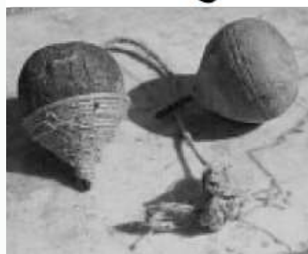
Giochi di una volta, la bambola di pezza, la fionda e la trottola