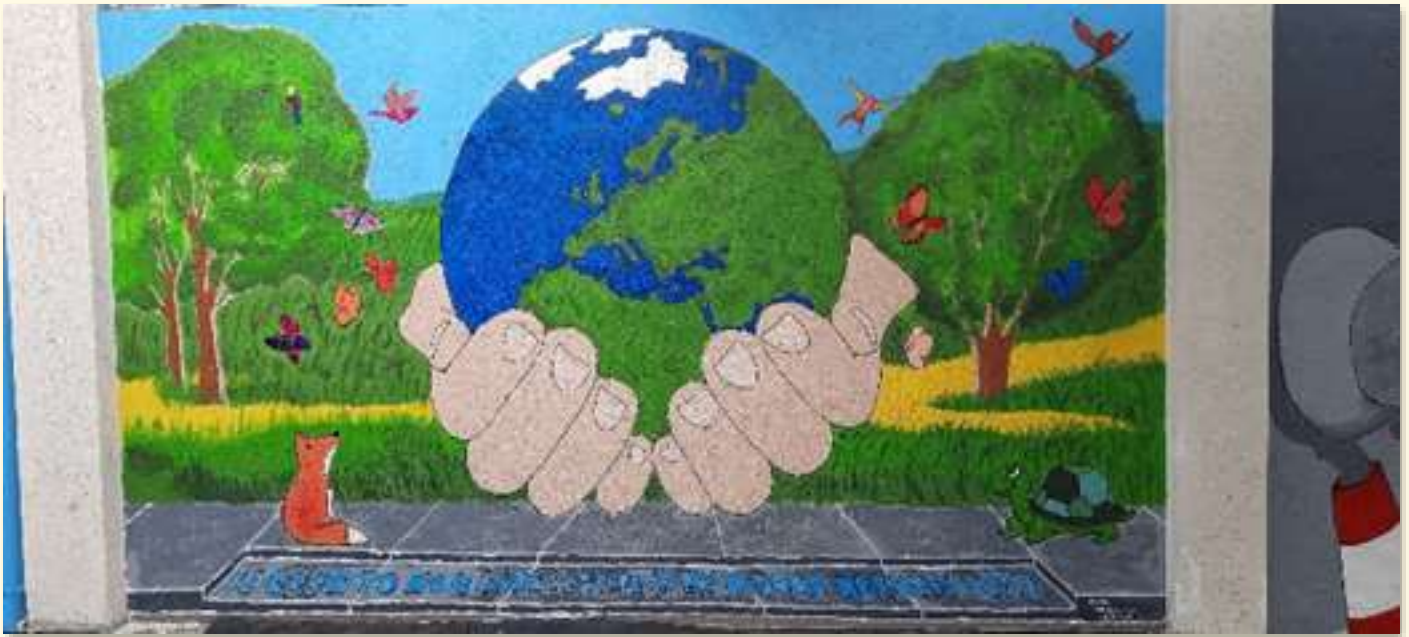
Il laboratorio di murales ha completato il disegno che doveva realizzare su uno dei muri della parrocchia

non è passare un mese fuori casa perché non si ha nulla da fare, ma è quello di regalare ai bambini delle emozioni, dei sorrisi e dei ricordi e soprattutto di mettersi in gioco, di impegnarsi e di aiutare il prossimo. Il Grest finisce con una grande festa, una grande cena in campo della parrocchia, dove