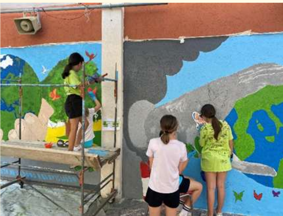
Le bambine del laboratorio di murales finiscono di colorare il loro capolavoro