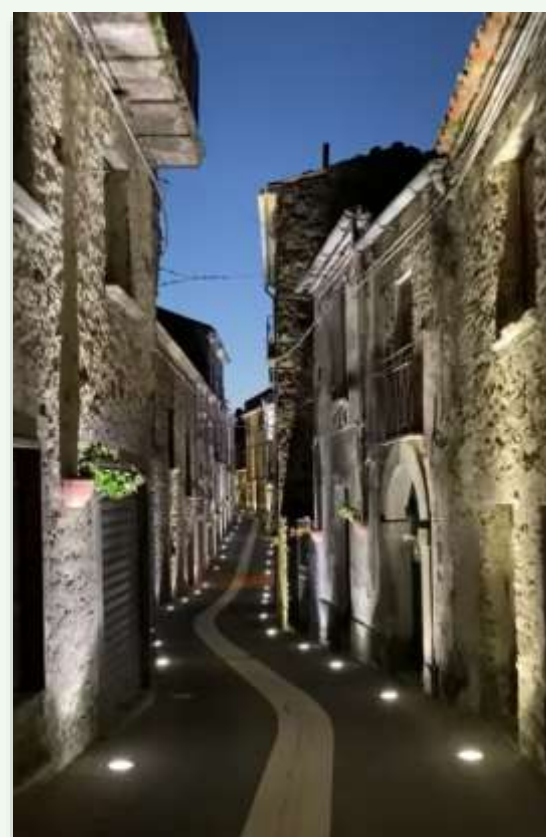
Corso Umberto I a Orria visto di sera