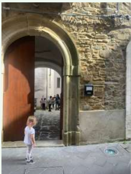
Portone del Palazzo socchiuso

In una stanzetta del piano terra vi era la bottega del calzolaio, detto anche ciabattino , che non solo riparava, ma faceva anche scarpe su misura per gli abitanti del paese ed erano pezzi di grande pregio. Stavo a guardarlo mentre seduto su una sedia di paglia, con un grembiule di pelle, con le mani tirava spaghi, forava il cuoio, cuciva e inchiodava. Oggi nel mio paese è scomparso un mestiere così importante come quello del calzolaio: le scarpe rotte o vecchie, infatti, vengono buttate nella spazzatura. Oggi è l'era "dell'usa e getta".