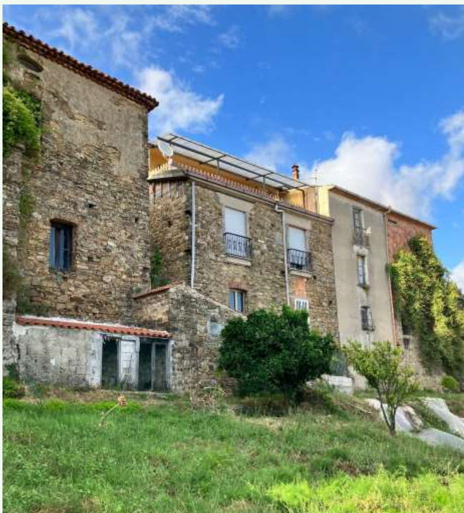
Lato via Duca Erminio Gugliucci

nel mio bar si viveva come una grande famiglia. Di giorno, davanti al bar, i bambini si divertivano a fare i giochi di una volta e io potevo ammirare la loro creatività e la loro inventiva.