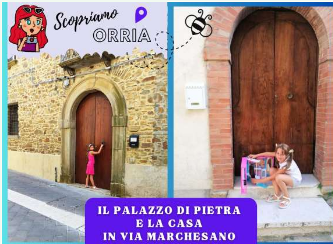
IL PALAZZO DI PIETRA E LA CASA IN VIA MARCHESANO

La Wigwam Local Community Cilento - Italy