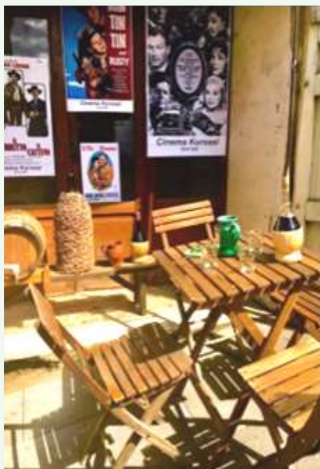
Ricostruzione del Bar in via Marchesano

re insieme delle piacevoli ore. Erano dei momenti di aggregazione e di socializzazione molto importanti dopo un intenso lavoro, perché a quei tempi anche la maggior parte dei bambini e dei giovani andavano a lavorare nei campi con i genitori e i nonni. È stato un periodo eccezionale: infatti, era fantastico ascoltare i nonni che raccontavano ai piccoli le storie della loro gioventù e le tante leggende che caratterizzano il mio paese.