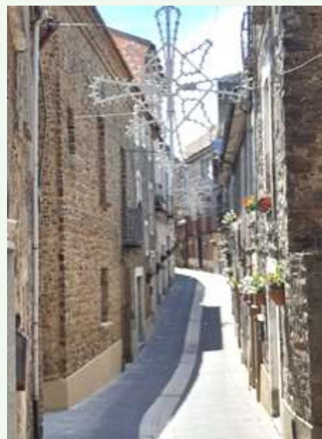
Il Corso Umberto I con il palazzo di pietra sulla sinistra