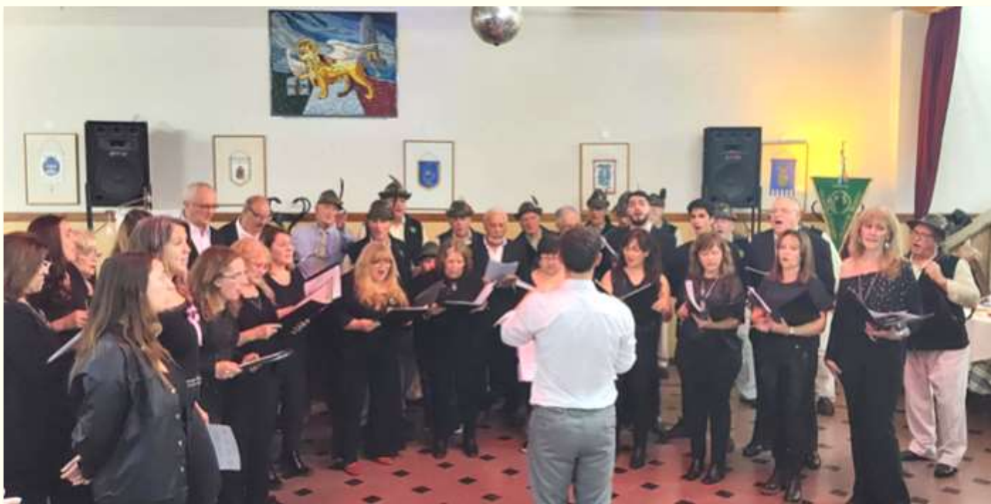
Il Coro veneto di Rosario (Argentina)

immateriale del Veneto comunità e italiani della nostra città. Per concludere, insieme, entrambi i cori hanno eseguito “Va pensiero”, in uno dei momenti più emozionanti della giornata.