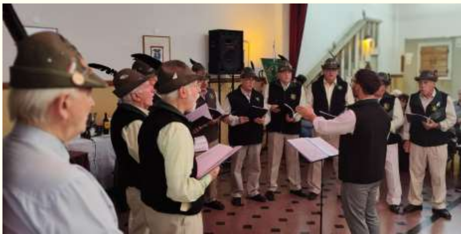
Il Coro alpino di Rosario

Venerdì 29 settembre è andato in scena “ Verdi Poietico ”, uno spettacolo