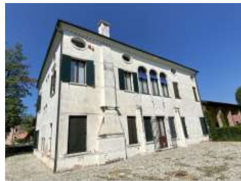
Villa Querini a Camposampiero, sede della Federazione dei Comuni del Camposampierese

- la comunicazione online (sito, social) e offline come nuove pubblicazioni (guide, mappe...)