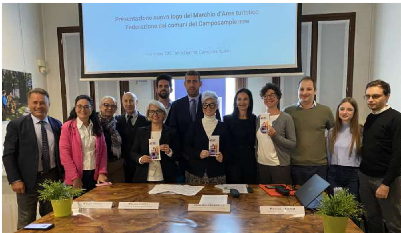
Lo staff della Federazione dei Comuni del Camposampierese