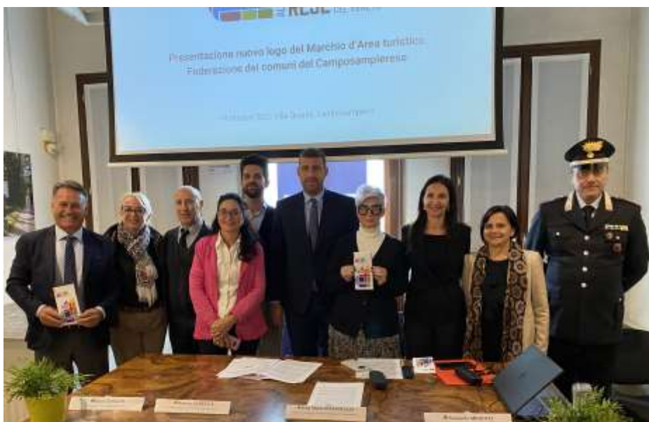
Sindaci e autorità della Federazione dei Comuni del Camposampierese