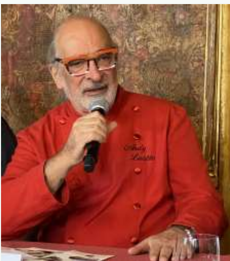
Andy Luotto, attore e Chef