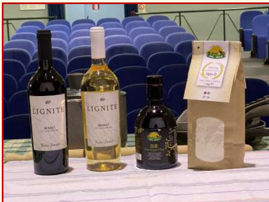
Azienda Vitivinicola Tiberio Ferretti e Azienda Agricola Dal Sole