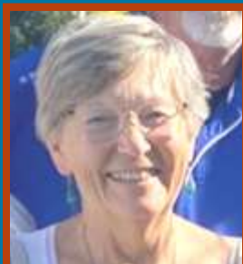
Giulia Gerloni Wigwam Linkman Basso Garda Bresciano Loc. Community

c/c Postale n. 69120327 intestato a Wigwam APS Italia o con bonifico a IBAN IT86X0760112100000069120327 BIC/SWIFT BPPITRXXX