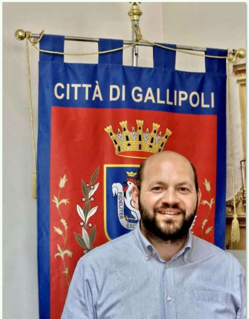
Stefano Minerva, Sindaco di Gallipoli