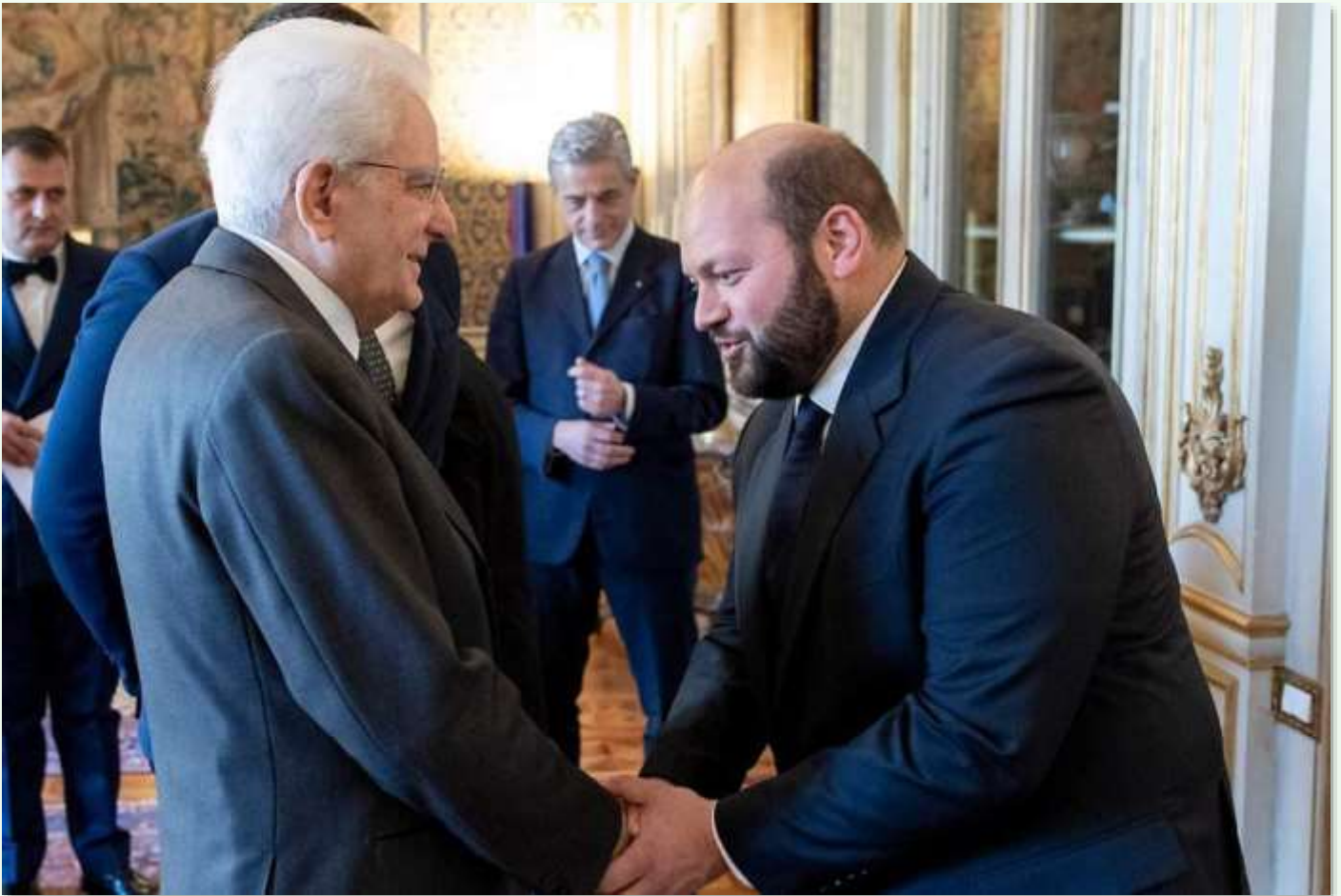
Stefano Minerva e Mattarella

cato un immenso danno ambientale e paesaggistico conseguito dalla necessità di procedere all'abbattimento delle piante o il loro abbandono.