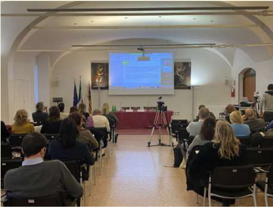
La sessione del Forum in Sala Paladin di Palazzo Moroni

to un'opportunità di formazione sul tema degli eventi ambientalmente sostenibili e socialmente