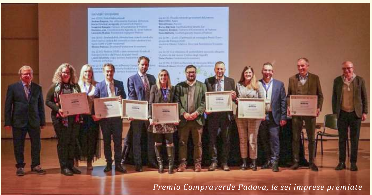
Premio Compraverde Padova, le sei imprese premiate