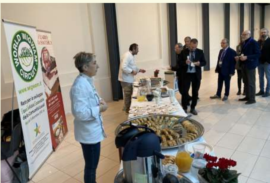
I prodotti BIO, di Filierecorte, del commercio equo-solidale e a Km zero di fattorie e artigiani della Rete delle Comunità Locali equo-sostenibili Wigwam, serviti al Centro Culturale Altinate-San Gaetano