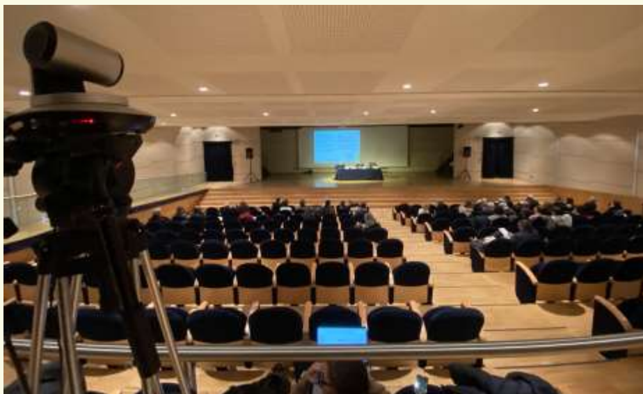
La sessione del Forum nell'Auditorium del Centro Altinate-San Gaetano

e best practices per gli eventi sostenibili", di Regione Emilia Romagna e Art-ER.