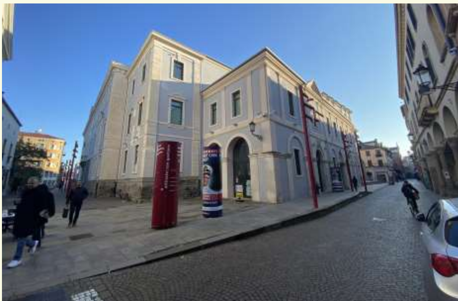
Il Centro Culturale Altinate-San Gaetano di Padova

Il premio, realizzato in collaborazione con Camera di Commercio, Confindustria Veneto Est, Cna