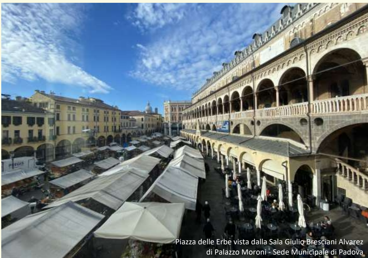
Piazza delle Erbe vista dalla Sala Giulio Bresciani Alvarez di Palazzo Moroni - Sede Municipale di Padova

La Wigwam Local Community Padova - Italy