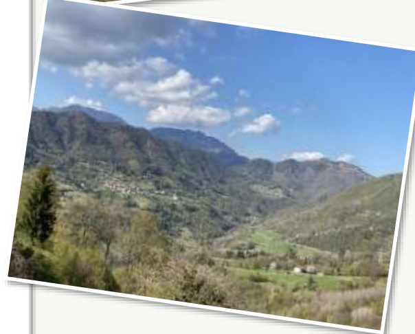
Cartoline di Costa e della sua vallata.