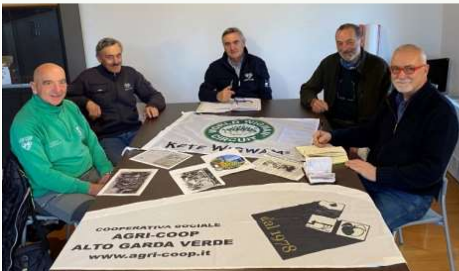
Incontri preparatori dei due Cinquantenari del 2022: