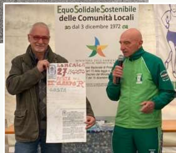
Sopra: la riedizione del 2022 della storica Staffetta di Costa