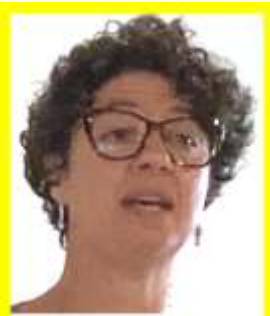
Mariadaudia Crivellaro Ufficio Turismo Camposampierese Corrispondenza dalla Comunità Locale Wigwam del Camposampierese