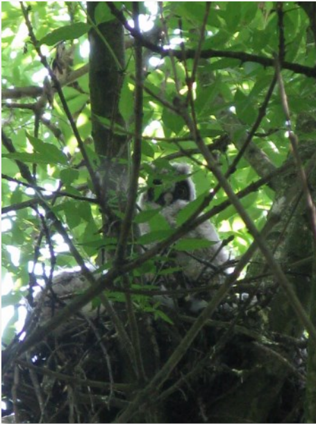
Il Gufo nel suo nido

lo, il Sanguinello, la Frangola, il Corniolo, il Prugnolo, e tanti altri. In particolare è stata molto preziosa la presenza dell'Ontano nero perché sin dai primi anni in cui le piante hanno iniziato a produrre le "pignette" con all'interno i piccolissimi semi, ho assistito all'arrivo nella stagione autunno-inverno degli stormi di piccoli uccellini verdi, che io subito avevo denominato "L'Oselin belverde" prendendo spunto dal nome di un personaggio dalle favole della civiltà contadina, lette nei testi di Dino Coltro ed anche recitate in dialetto veronese nella Compagnia teatrale "Il Piccolo Teatro di Oppeano.