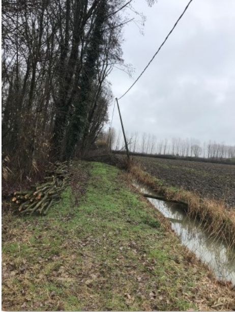
L'entrata del bosco