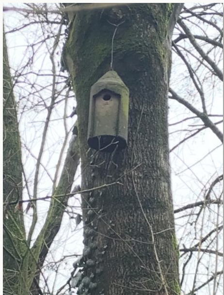
Nido artificiale di cinciallegra

preso a parlare guardando la foto del Gufo nel cellulare e, continuando la nostra passeggiata eravamo arrivati proprio nel punto in cui io avevo avuto molti anni prima il "saluto" del Gufo con il battito d'ali sul cappello e poi la sua presenza quotidiana sull'albero di Quercia mentre facevo i lavori per allestire