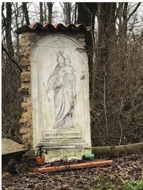
Madonna del bosco