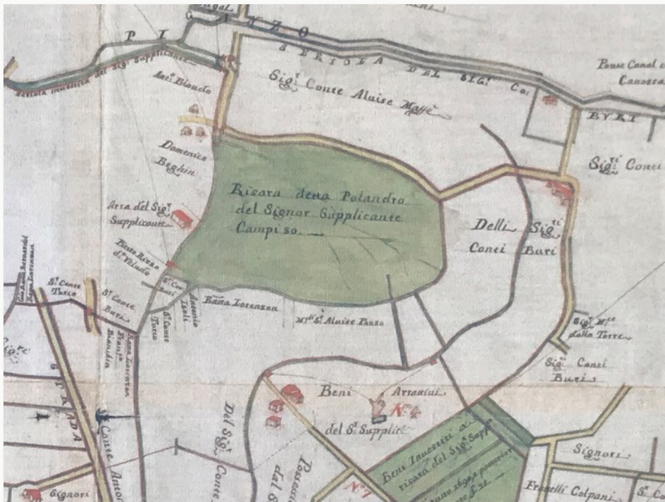
Risara detta Polandro. Mappa del 1713