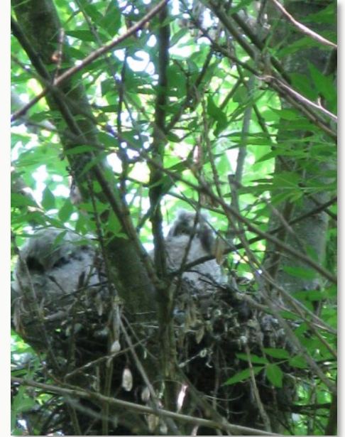
Nido di gufi