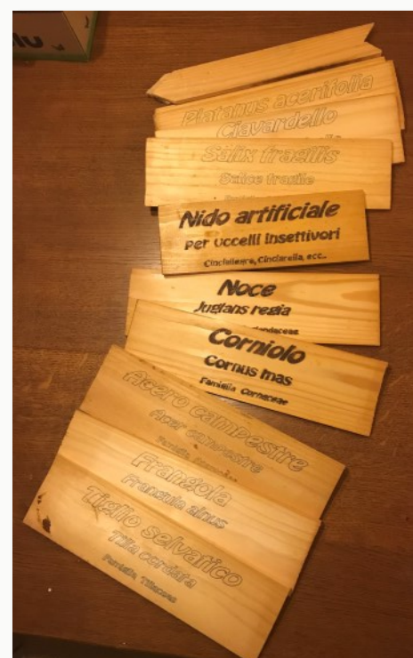
Nomenclatura del Bosco del Polandro fatta con pirografo

Il modulo di impianto del Bosco di Corte Polandro aveva previsto anche alberi di seconda grandezza come l'Ontano nero ( Alnus glutinosa ) e cespugli diversi, come il Nocciu-