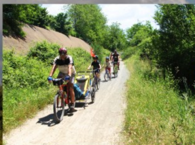
Percorri i binari del rinnovamento