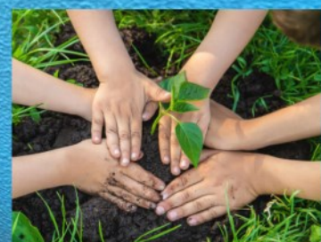
SEMI DI CULTURA Un viaggio tra zucchero e cereali