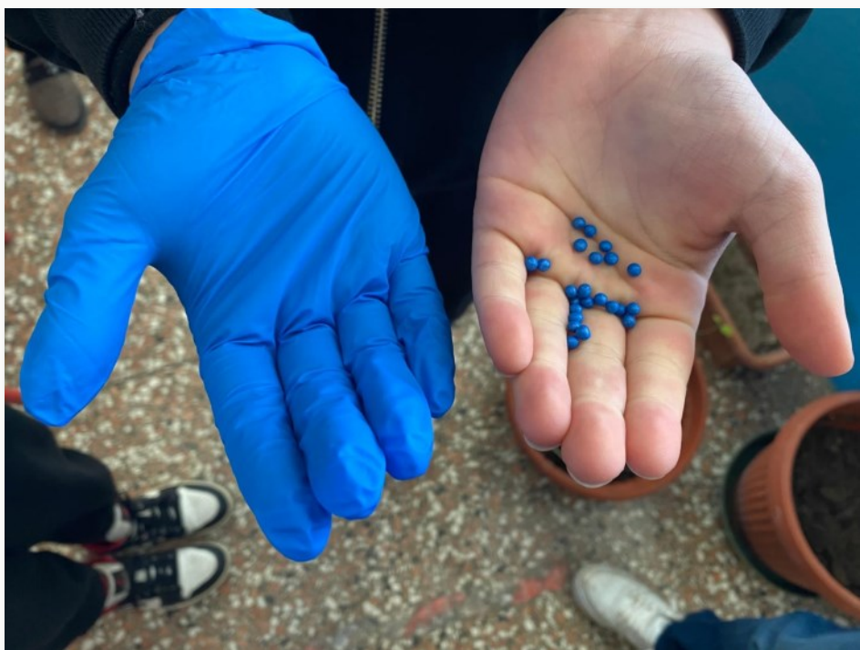
Semi di barbabietola

Le curiosità emerse dagli alunni sono state