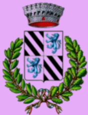
Con il patrocinio del Comune di Orria (Sa)

Q uando è stato proiettato per la prima volta "Nuovo Cinema Paradiso" di Giuseppe Tornatore, con la celebre colonna sonora di Ennio Morricone, nonostante parlasse di un piccolo paese siciliano, sembrava parlasse di noi e questo ha svolto un ruolo cruciale nella storia di Orria, ispirando una passione per il cinema che è stata tramandata di generazione in generazione.