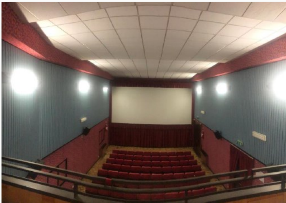
La Sala del Cinema Kursaal vista dalla Galleria

porte chiudendo anche tante opportunità di condivisione e connessione per la nostra comunità.