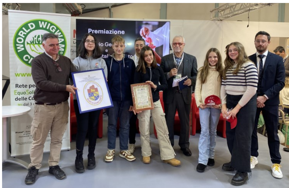
Gli alunni del Convitto Nazionale "Marco Foscarini" di Venezia premiati per il Cantiere di Esperienza Partecipativa "Generazione Zeta Giovani Reporter", lavoro di gruppo

Barbuio, marconista di Zemi-niana e le voci nell'aria. WigwamNews n. 39 del 8 febbraio 2024.