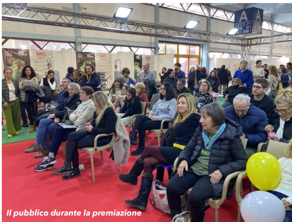
Il pubblico durante la premiazione

CEP 8 GENERAZIONE ZETA GIOVANI REPORTER - Convitto Foscarini (Ve) - PRIMO PREMIO NAZIONALE CEP 2024