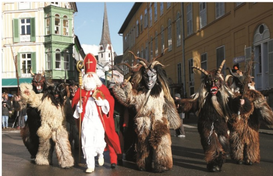
San Nicolò, I Krampus

culto continua a essere una delle tradizioni religiose più radicate nel mondo cristiano.