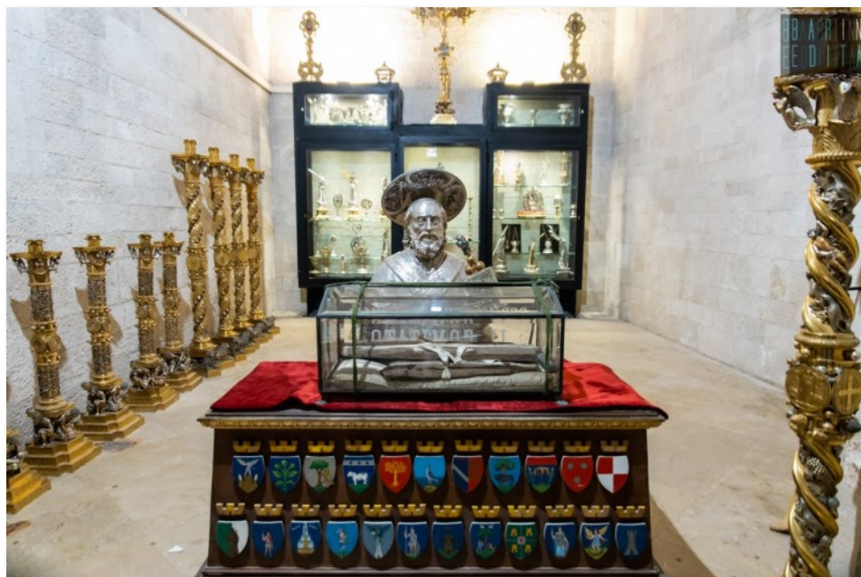
Bari. Il tesoro di San Nicola

conta che, durante il concilio, schiaffeggiò l'eretico Ario per la sua blasfemia. Questo gesto gli costò temporaneamente la sospensione dall'ufficio vescovile, ma fu riabilitato in seguito. Morì a Myra il 6 dicembre del 343 e le sue reliquie furono conservate nella cattedrale della città.