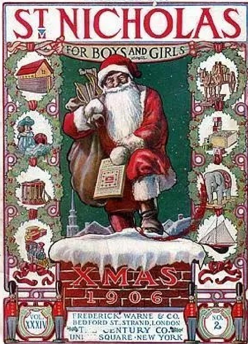
1906, Babbo Natale pre Coca-Cola

A FAIRY STORY BY FRANCES HODGSON BURNETT DECEMBER 1906