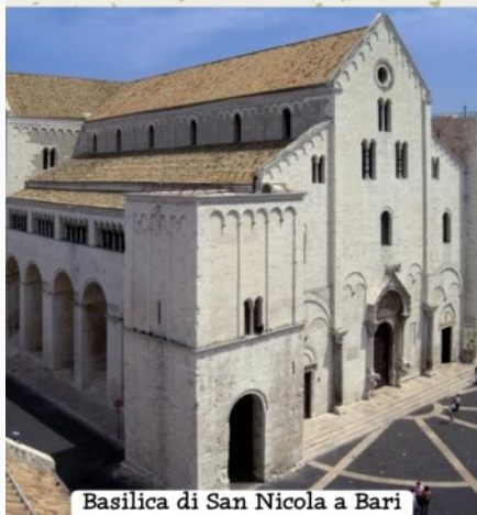
Basilica di San Nicola a Bari