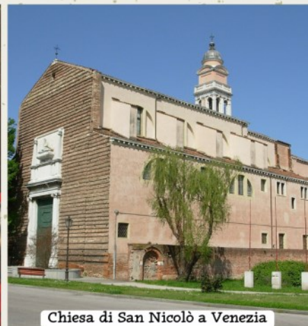
Chiesa di San Nicolò a Venezia