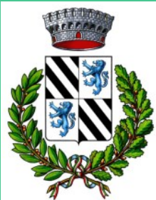
Con il patrocinio del Comune di Orria (Sa)

Gli elaborati finalisti sono stati ben 14 e la Giuria Generale del Premio, costituita dai rappresentati della Stampa Nazionale, li ha decretati vincitori del secondo posto su scala nazionale!