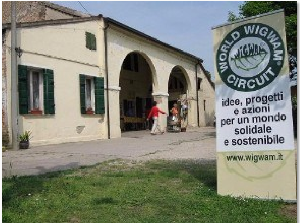
La sede del Circolo di Campagna Wigwam "Il Presidio" Aps di Granze di Camin (Pd)

Produce musica per progetti video nel suo Casa Foresta ho-