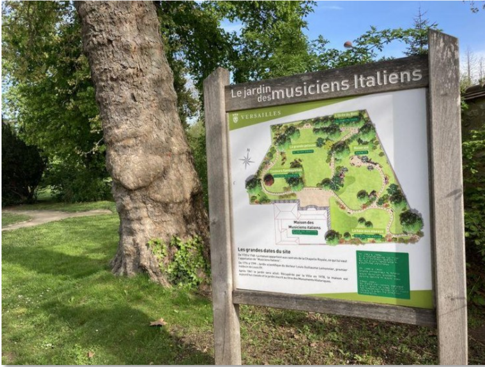
Le jardin des musiciens Italiens a Versailles

Affrontano svariate materie: recitazione teatrale, drammaturgia, uso e costruzione della maschera, mimo e pantomima, clownerie, scherma teatrale, canto corale, danze popolari, flamenco, tip tap, trucco scenico, teatro di figura e organizzazione teatrale. L'obiettivo dell'accademia è di creare per ogni classe una compagnia che sia una vera e propria impresa teatrale in cui ogni componente si responsabilizza in un ruolo: c'è chi si occupa della parte burocratica e amministrativa, chi dei costumi, chi del palco e dell'attrezzatura, chi di trovare le date per gli spettacoli e così via.