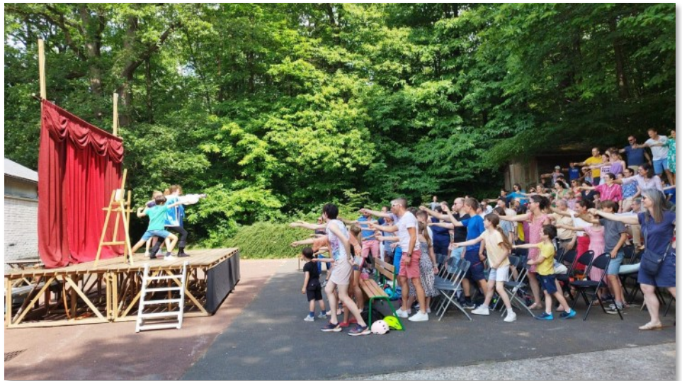
I Tre Moschettieri nel cortile posteriore dell'Accademia

Mentre stavo completando i miei studi universitari in lingue e letterature europee e ame-