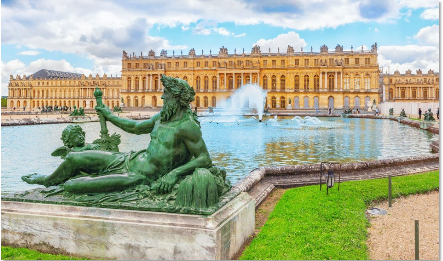
La maestosa Reggia di Versailles

Sono luoghi di incontro, informazione, e promozione del legame sociale, con lo scopo di facilitare la partecipazione dei cittadini alla vita del quartiere e di creare un senso di appartenenza. Troviamo inoltre un teatro di 550 posti nel cuore della città, il Théâtre Montansier, 6 biblioteche di quartiere più la biblioteca centrale che ospita opere di valore inestimabile, tra cui documenti sull'indipendenza americana, corrispondenza di George Washington e opere personali di Maria Antonietta.