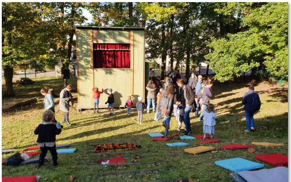
Il teatrino dei burattini

talia con gli spettacoli creati dall’AIDAS e così 5 anni fa iniziammo una piccola tournée italiana con il “Sogno di una notte di