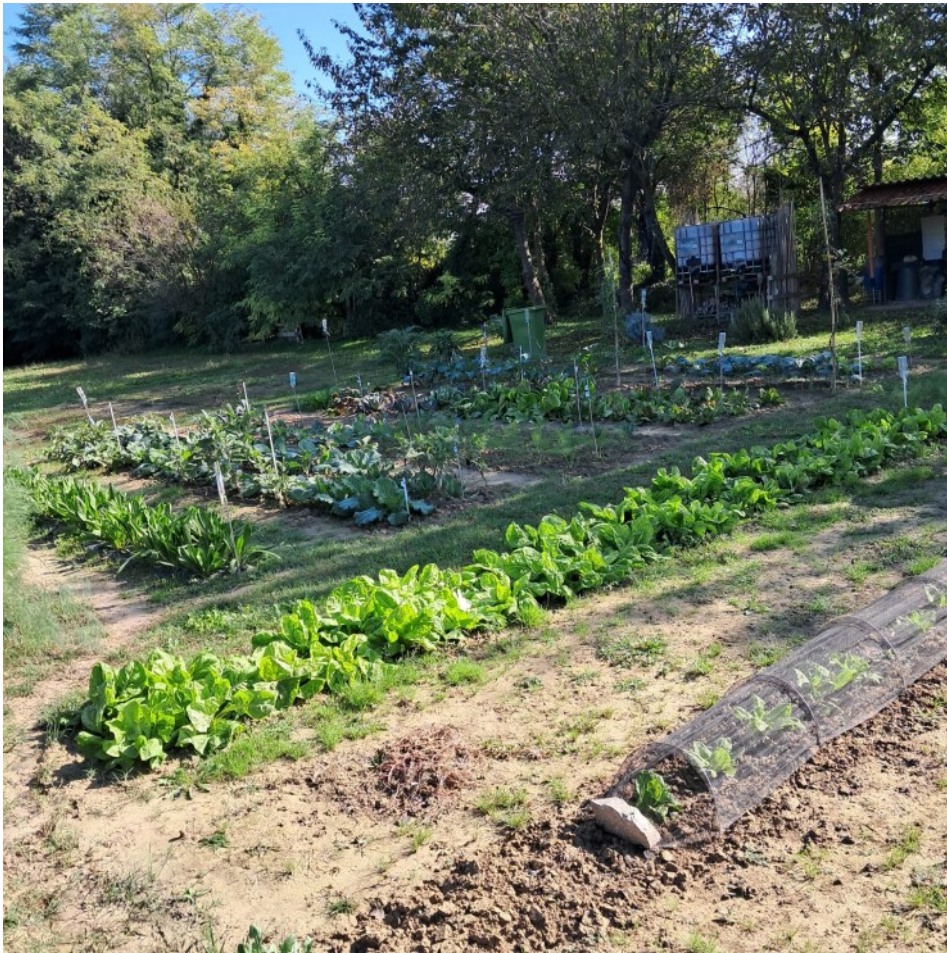
Gli orti del Circolo di Campagna Wigwam Il Presidio