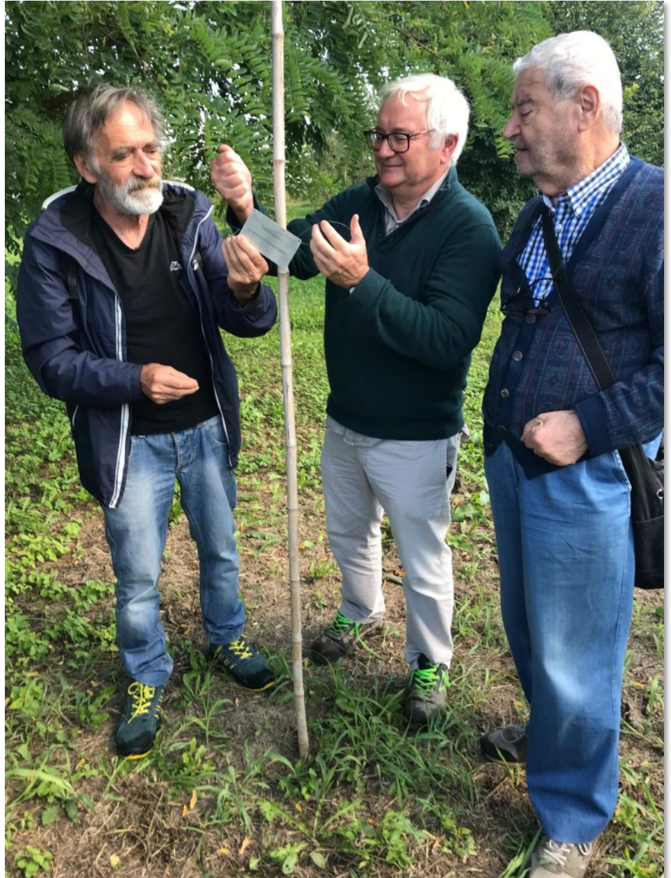
Targa in memoria di Orlando Bollettin

menti a cui erano legate le vite delle persone e allo stesso tempo diventa importante capire e ricordare che cosa i luoghi hanno significato anche solo in un passaggio non troppo lontano.