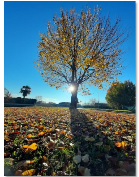
Il parco GreenGranze

Visto il grande interesse suscitato da questa iniziativa, ci riproponiamo di replicarla almeno una volta al mese fino a fine anno ■