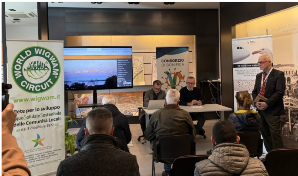
La presentazione alla sede del Consorzio di Bonifica del Veneto Orientale

di tecnologie di intelligenza artificiale proprietaria) è quello di fornire con tempestività elementi oggettivamente verificabili, utili ai decisori per applicare misure correttive e pianificare azioni di medio lungo termine sulla base di informazioni oggettive e sempre aggiornate. Sia per comprendere la sostenibilità di corridoi per l'urban air mobility in aree ambientalmente sensibili.