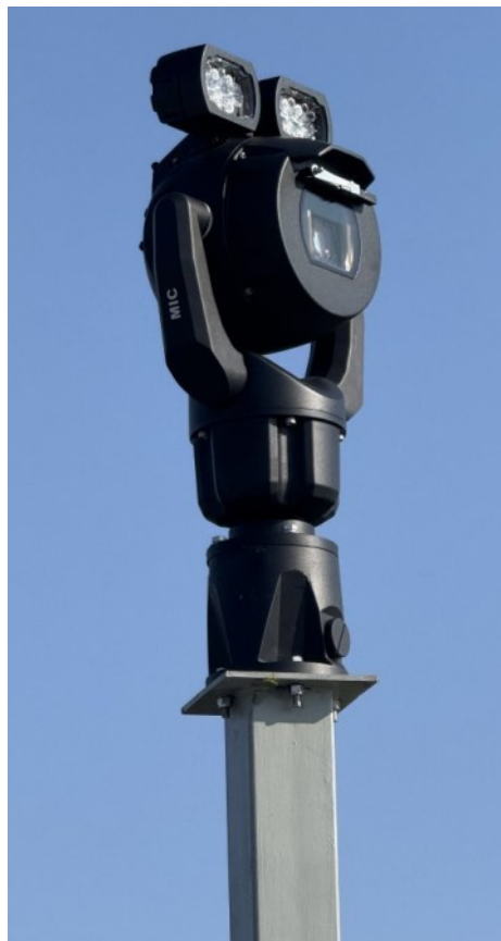
Il sistema di rilevamento ai Lanzoni

correlazione tra i vari dati presi in esame è già chiara: offre una fotografia in tempo reale della situazione avi-faunistica dell'area, con il vantaggio di riuscire a prevedere dove e quando voleranno gli uccelli. Tale risultato non è solo entusiasmante, ma molto utile anche per altri impieghi del sistema BCMS, primo tra tutti per il suo uso negli aeroporti per evitare gli impatti tra aerei e fauna selvatica, i cosiddetti bird strike.