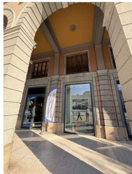
L'Infopoint del Consorzio di Bonifica a San Donà di Piave (Ve)

dell'attività. Un innalzamento termico modula positivamente il metabolismo e il foraging (ricerca di cibo) degli uccelli, agendo da fattore di controllo sulla modulazione dell'attività quotidiana.