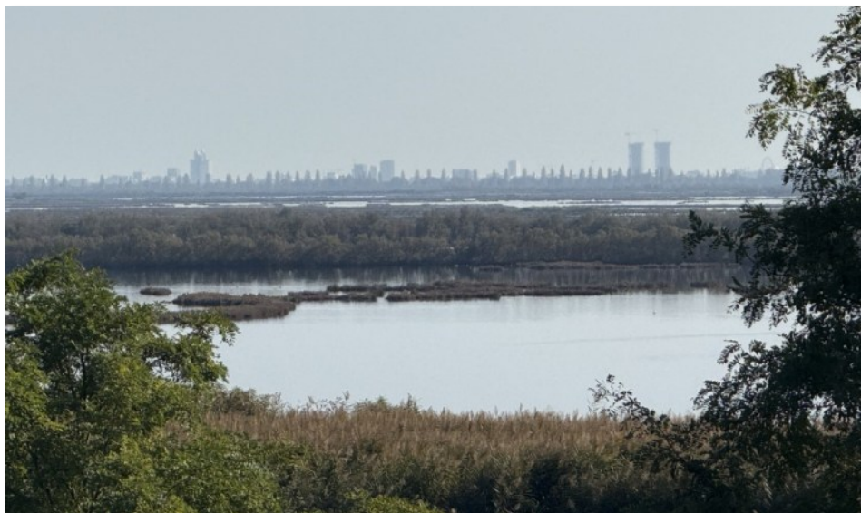
Skyline di Jesolo dal punto di rilevamento dell'Idrovora di Lanzoni