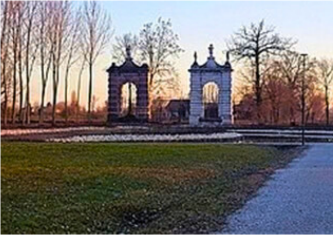
Villa Baglioni, Camposampiero (Pd)