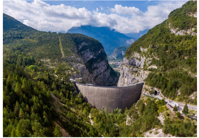
Diga del Vajont