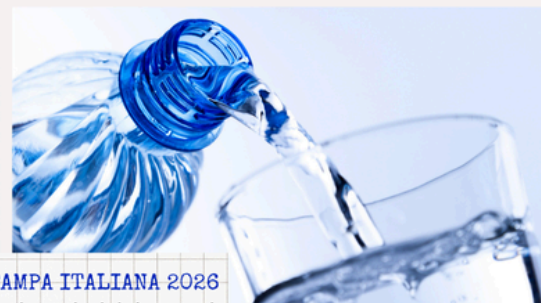
PREMIO WIGWAM STAMPA ITALIANA 2026 presentazione dei nuovi cantieri dei ragazzi dell'IIS 8 Marzo K. Lorenz