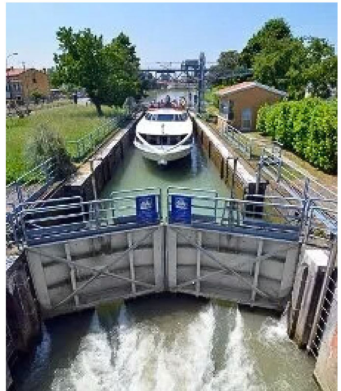
Una chiusa fluviale

Per concludere, gli studenti dell’IIS 8 Marzo-K. Lorenz, che aderiscono al progetto Premio Stampa Wigwam 2026 sul tema del filo d’acqua e delle forme di attivismo dei giovani nella salvaguardia delle tradizioni e dei luoghi della Comunità del Miranese, si pongono come obiettivo quello di diffondere la cultura del rispetto dell’ambiente, in particolar modo fluviale, nonché di sensibilizzare l’opinione pubblica verso la cura e la valorizzazione del patrimonio artistico-culturale-naturale presente sul territorio