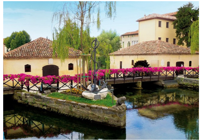
Mulino e lavatoio di Portogruaro

L'acqua a volte crea, talvolta distrugge, a volte salva e talvolta uccide. Lo sa chi ha vissuto l'Acqua Granda di quel terribile 12 novembre 2019. Un'apocalisse tutta veneziana, prima dell'apocalisse mondiale del Covid: chiedetelo agli addetti alla reception dell'esclusivo hotel Danieli, quando si sono visti entrare dalla porta d'ingresso, anziché un VIP, un VAPoretto. Ci ha pensato, poi, il "signor" Mose a fermarlo ... il mare, non il vaporetto. Abbiate pazienza, abbiate pazienza: il CEP 8 Marzo-K. Lorenz vi racconterà tutto.