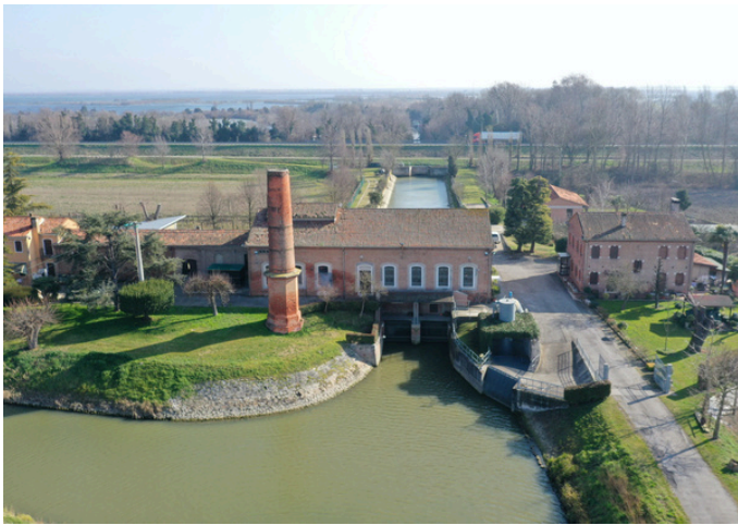
Idrovora di Lova di Campagna Lupia