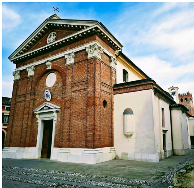
La Chiesa arcipretale dei S.S. Felice e Fortunato di Noale

Un altro punto di svago è l'Acquestate di Noale nel quale è un parco acquatico nel quale ci sono attrazioni molto belle che ti fanno provare i brividi e poi c'è una zona break nel quale si fare merenda con ciò che ti piace di più o a base salata con delle patatine fritte, normali, toast e pizzette o a base dolce tra granite, wafer, gelati. All'interno dell'Acquestate si possono trovare delle piscine interne dove poter praticare acquagym oppure nuoto libero. Nella città di Noale si può trovare anche un ospedale nel quale si accede quando si ha problematiche a livello fisico o psicologico, di fianco si può trovare anche la guardia medica. A Noale si possono trovare industrie alimentari come supermercati: Aldi, Iperlando, Easy market che è un negozio dei cinesi nel quale al suo interno si possono trovare abiti, reparto scolastico ed anche in ambito lavorativo legato anche alla casa.