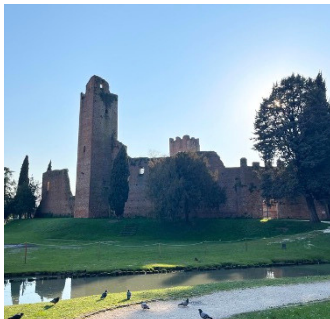
La Rocca dei Tempesta di Noale

Un'altra festa che è di tradizione è il Palio di Noale che è la mia tradizione preferita perché mi piace vedere i bambini sfilare, i vari costumi, il cibo, vedere gli spettacoli degli sbandieratori, tutti i banchetti, degli animali e gli sputafuoco. Questa manifestazione ha come scopo di ricordare quello che era il passato della città in epoca medioevale e come simbolo principale c'è il saluto da parte di ogni contrada al loro signore Lampedusio Tempesta. Una particolarità che ho notato di questa meravigliosa Noale è che è divisa in isolotti dal fiume Marzenego, isolotti che sono collegati tra loro tramite ponti. Un'altra festa molto bella è la festa dei fiori che rappresenta un tappeto dei fiori nel quale i ragazzi della prima comunione lo calpestando e viene chiamato "corpus domini".