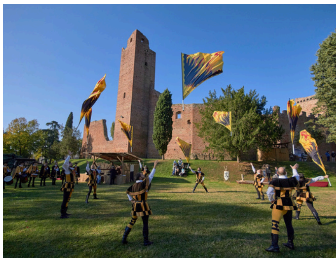
Il Palio di Noale

In estate offre il Grest dove i bambini insieme agli animatori nel quale si divertono, ballano, fanno merenda e giocano, all'interno del grest ci sono anche i laboratori per varie età e possono variare a seconda di quello che decide l'animatore e questi laboratori comprendono: traforo, art attack, in sport, design. Verso l'ultima settimana i bambini si preparano per la serata finale che si basa sul teatro, balletti e infine sulla presentazione delle squadre con i bambini che hanno partecipato.