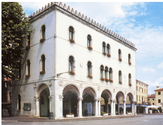
Il Palazzo della Loggia in Piazza Castello a Noale