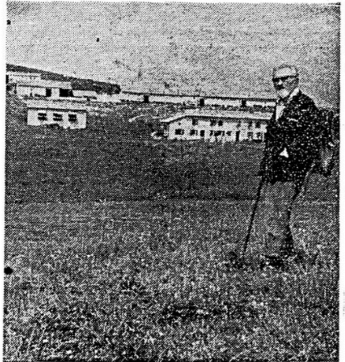
La malga sulle pendici del monte Cesen dove saranno ospitati i giovani aderenti all'iniziativa.

Un cantiere di lavoro sul monte Cesen riservato ai giovani - Corsi informativi