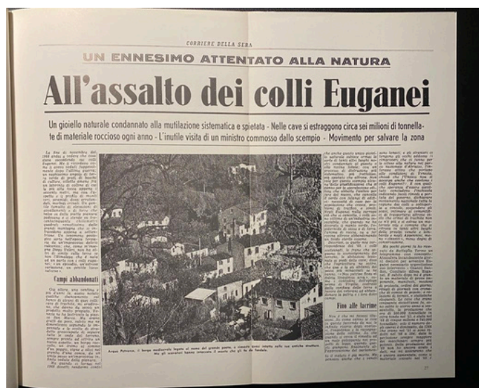
Il Corriere della Sera che portò all'attenzione nazionale il disastro delle cave

La legge ebbe un percorso molto travagliato a causa della resistenza opposta dalle lobby dei cementieri e dei cavaatori e fu l'abilità dell'onorevole Giuseppe Romanato di Rovigo a permetterle di arrivare all'approvazione, il 24 novembre 1971.