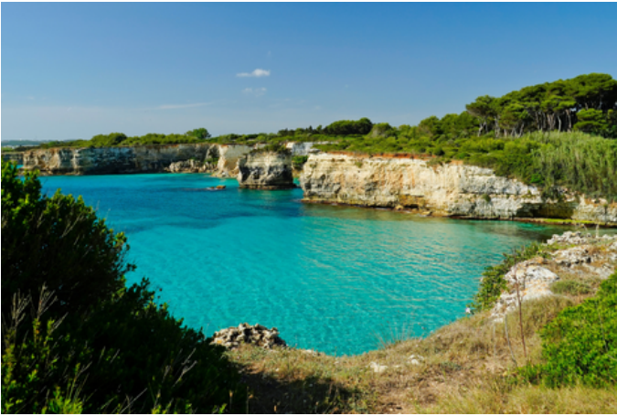
Baia del Mulino d'Acqua